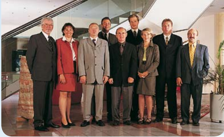
Les dirigeants des différents bureaux du Groupe Hans & Associés